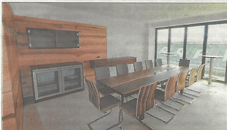
Die Business-Loge der Wiener Firma Sochor im neuen Allianz-Stadion des SK Rapid Wien besticht durch ihre besondere Einrichtung.